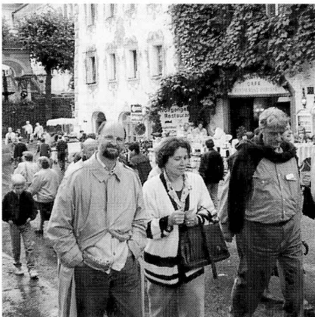
Ausflüge gehören zum Programm der „Salzburger Gespräche“.