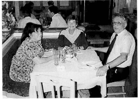
Teilnehmer/innen aus Polen.

Die ideelle Bedingungsebene ist gekennzeichnet durch ein manichäisches Weltbild im einzelnen das heißt, zumindest in dieser Vorstellungswelt gibt es die strikte Teilung der Welt in Schwarz und Weiß sowie in Gut und Böse. Das hat zur Folge, daß immer wieder Feindbilder verschiedenster Art aufgebaut werden. Man ist selbst der Gute, die anderen sind die Bösen und werden somit abgewertet und entrechtet. Damit sinkt die Schwelle, die den Menschen daran hindert, gegenüber anderen Gewalt anzuwenden. Ein zweites Element dieser ideellen Ebene ist so zu deuten, daß es innerhalb der Gesellschaften zwei Formen des Denkens gibt: einerseits ein intellektuell-rationales und andererseits ein intuitiv-emotionales ; wobei das erste problemorientiert arbeitet, während das zweite eher schlichtere Lösungen sucht und weiter verbreitet ist. In der Mehrheit der Bevölkerung entsteht häufig ein Ohnmachtsgefühl gegenüber den realen Entwicklungen, welche die derzeitige politische und