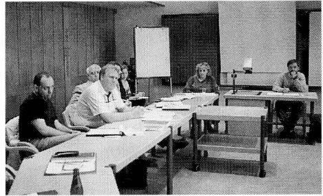
In Gruppen werden die Plenumsdiskussionen aufgearbeitet und konkrete Bildungsmodelle vorgestellt.